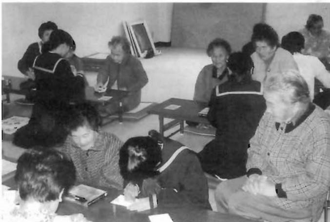
真穴地区社会福祉協議会(大島) ひとり暮らし老人のつどい