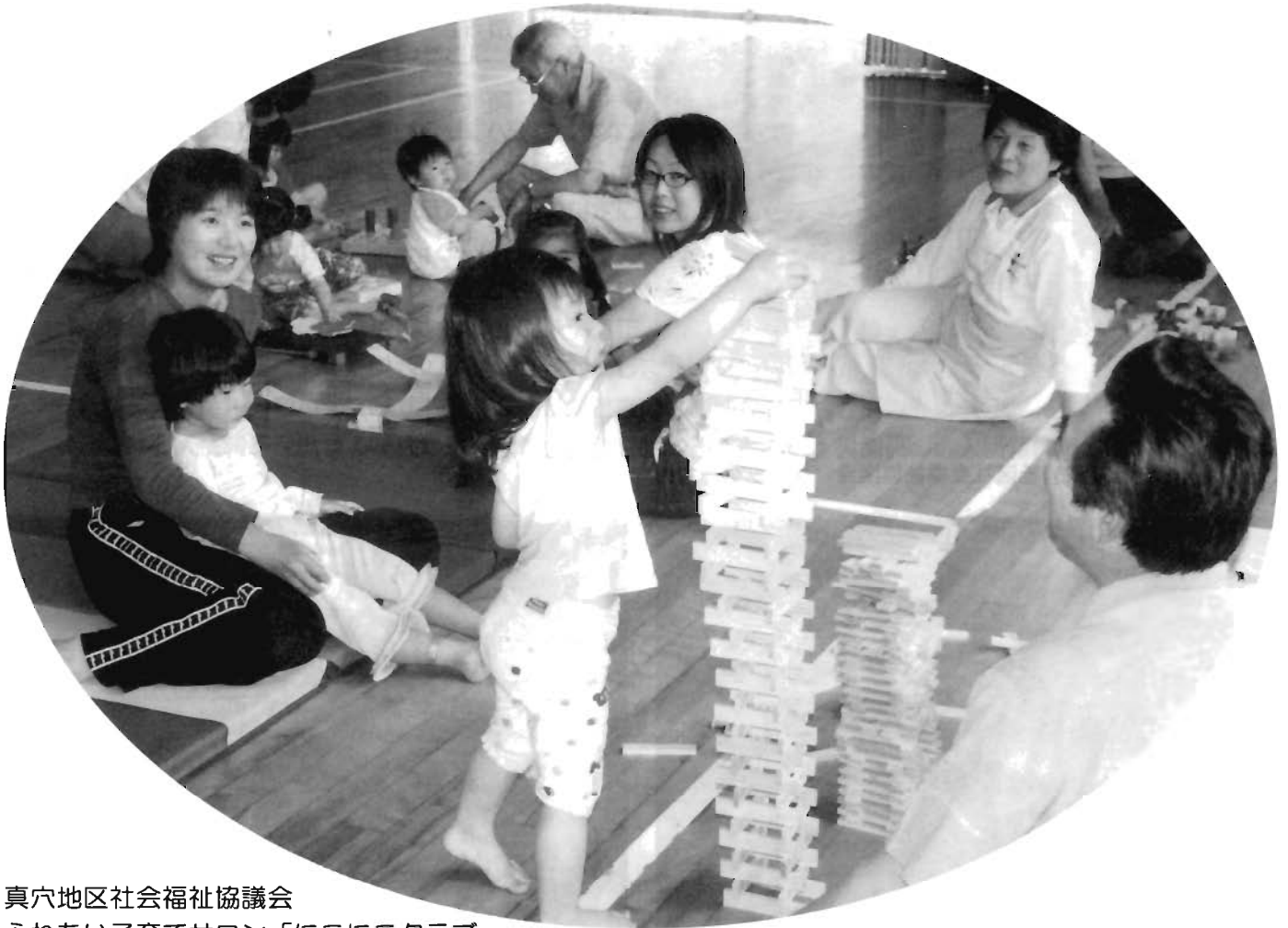
真穴地区社会福祉協議会 ふれあい子育てサロン「にこにこクラブ」

《発行》社会福祉法人 八幡浜市社会福祉協議会 八幡浜市松柏乙1101番地 八幡浜市保健福祉総合センター2階 TEL 23-2940 FAX 23-0506