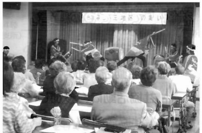
舌田・川上・真穴地区社会福祉協議会(合同) ひとり暮らし老人のつどい