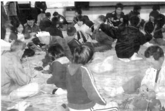
川上地区社会福祉協議会 三代目ふれあいの集い