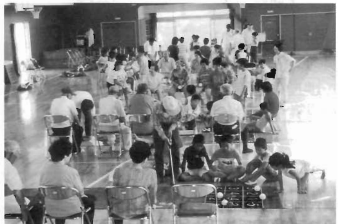
千丈地区社会福祉協議会 シャッフルゴルフ大会