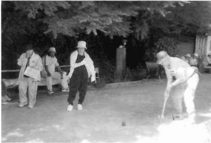
双岩地区社会福祉協議会 クロケット大会