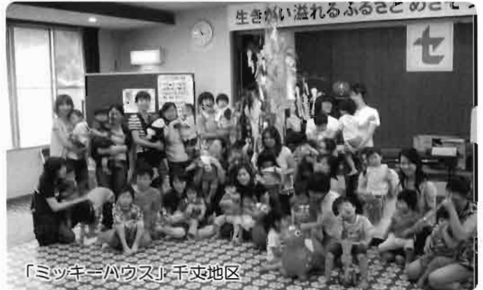
「ミッキーハウス」 千丈地区