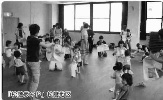
「松蔭ランド」 松蔭地区