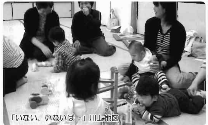
「いない、いないばー」 川上地区