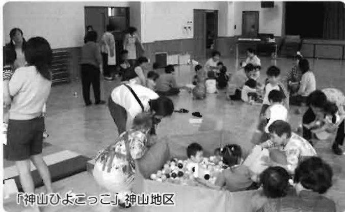
「神山ひよっこ」 神山地区

子育て中の親子が、月1回程度集い、楽しく遊んで交流・子育て相談・栄養指導等、地域で子育てを支援しようと、ボランティアさん達が共同募金配分金を使って助成支援してます。現在7ヶ所にて開催中 関心のある方、社会福祉協議会にお問い合わせ下さい。