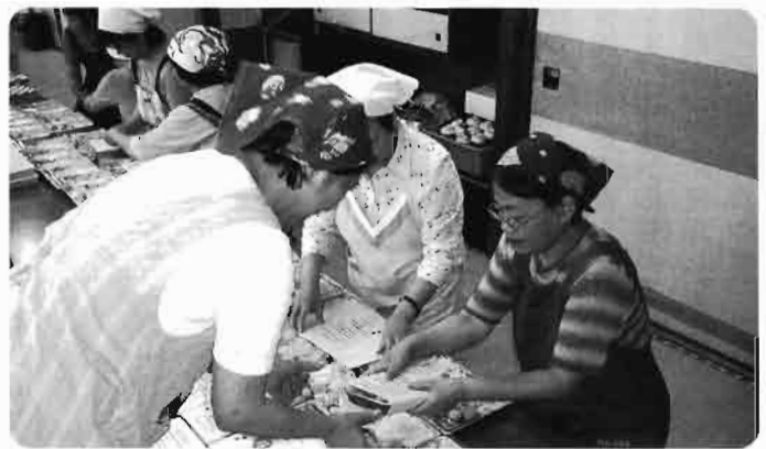
「給食サービス」保内