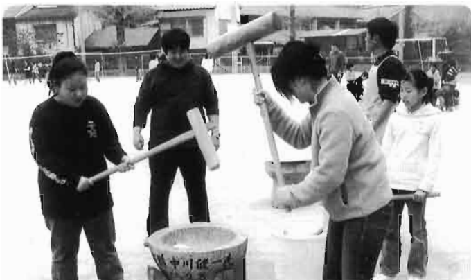
「神山福祉のつどい」神山地区