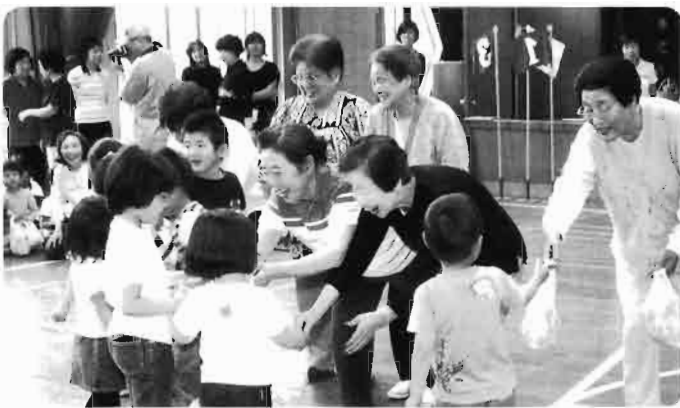
「三世代のつどい」松蔭地区