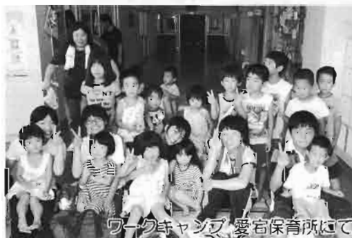
ワークキャンプ、愛宕保育所にて

をするのはけっこう緊張したけれど、とても楽しかったです。これからもたくさんの人たちとふれ合えたらいいなあと思いました。また、来年も参加出来たらいいなあと思います。