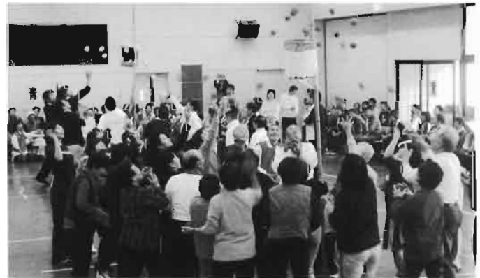
- 浜っ子ふれあい広場 玉入れ競争 -