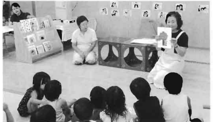
- 白浜地区 子育てサロン -