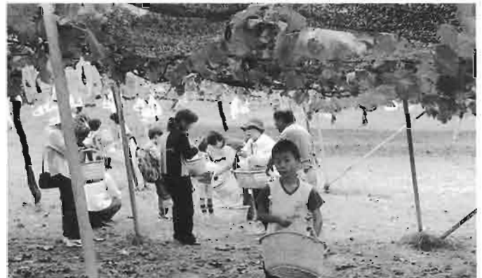
- 一日里親にて ぶどう狩り -