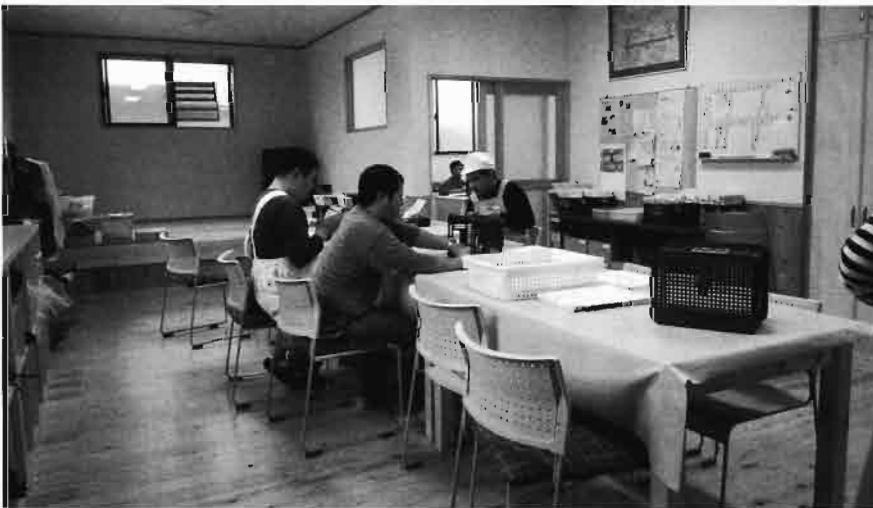
広々とした作業で、楽しく作業

ありがとうございました。この募金は、民生委員さんを通じて新年を迎える時期に、援助や支援を必要とする人たちや、少年ホーム、作業所へ総額2,627,000円が見舞金として配分され、残りは20年度の地域福祉活動に使われています。