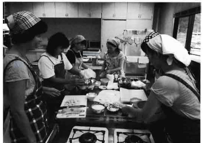
お母さんたちは子供たちのためにおやつ作り

おやつ作りでは、市の栄養士さんに来ていただき、公民館の調理室で手作りおやつの良さを話していただいた後、すぐ実習しました。ほとんどの子ども達も、子守りボランティアさんと二階のホールでおもちゃと遊ぶ