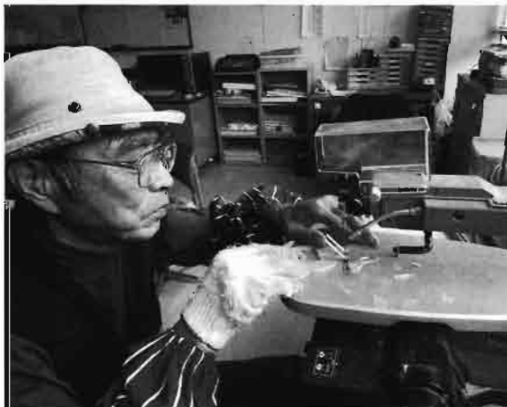
糸鋸で作品の製作に励んでいます。