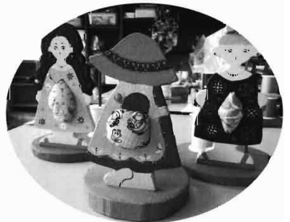
サンワーク松柏で販売しています。

卓上糸鋸等作業用機械を購入しました。片方の手だけでも簡単に作業が出来る様になり、助かっています。