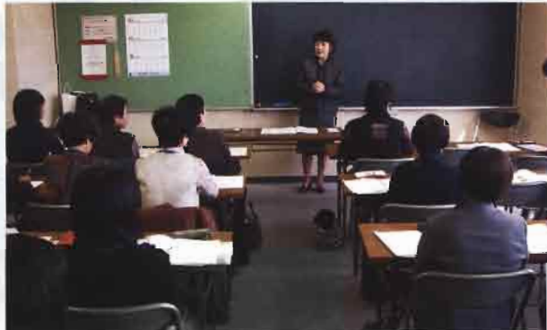
熱心に聴き方の技術を学ぶ受講生

そこで、八幡浜市社協では、今年初めて、高齢者や福祉施設の利用者の心に寄り添い、話し相手として活動できるボランティアを養成するために、傾聴ボランティア養成講座を開講しました。