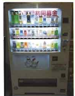
ことぶき荘に設置の自販機

企業、個人を問いません。ご協力いただける企業を募集しています。 詳しくは 八幡浜市社会福祉協議会 八幡浜市共同募金委員会 TEL 23-2940 FAX23-0506