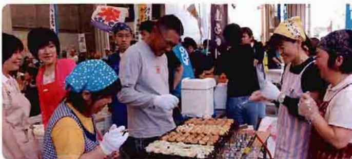
「福祉のつどい」で人気、行列の出来るたこ焼き ですよ