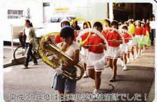
平成21年度は白旗小学校鼓笛隊でした！

とき：平成22年10月4日(月) 15時30分～ 場所：八幡浜市役所 → 新町5 → 新町1 → → 銀座商店街 → 八幡浜市民図書館