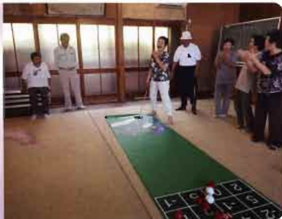
千丈地区「秋桜サロン」 シャッフルゴルフはサロンのト レンドです

平成21年度は 10,031,394 円の 共同募金配分金を受け、 様々な地域福祉事業 を行いました。