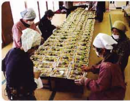
宮内地区社協「給食サービス」 ほっぺのおちる炊き込みご飯です。

平成21年度は 10,031,394 円の 共同募金配分金を受け、 様々な地域福祉事業 を行いました。