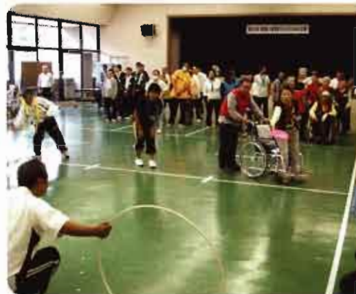
浜っ子ふれあい広場 毎年11月、誰もが童心にかえつ て、真剣勝負だ!!みなさんも遊 びに来てネ