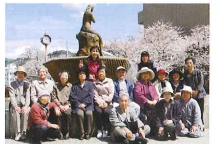
介護予防教室通所事業