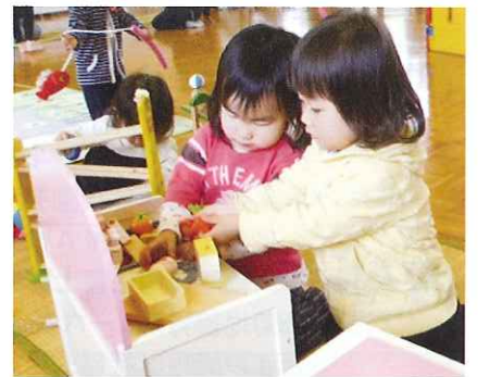
川上地区子育てサロン 「いないいないばあ」