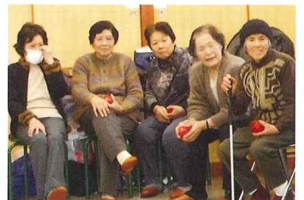
宮内地区 ふれあい・いきいきサロン 「のぎく会」