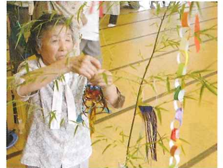
磯津地区 たなばたの集い