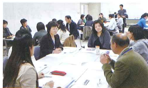
福祉後見入門講座