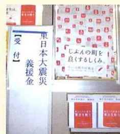
市社協本所の様子です