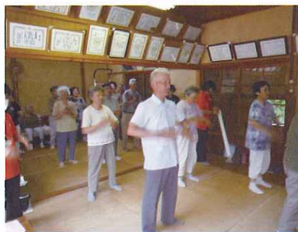
ふれあい・いきいきサロン (日土 いづしサロン)