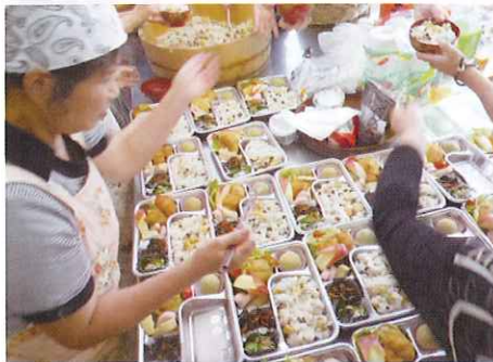
給食サービス (上：双岩地区 下：松蔭地区)