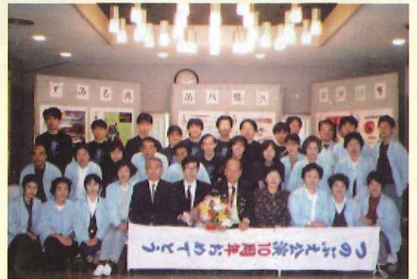
思い出の写真「つづのぶえ八幡浜講演10周年」

平成23年11月にはつづのぶえ八幡浜公演30周年の節目を迎えました。今年度よりまた新たな一歩を歩んでいきます。沢山の方がチケットを購入して頂き、足を運んで頂きたいです。