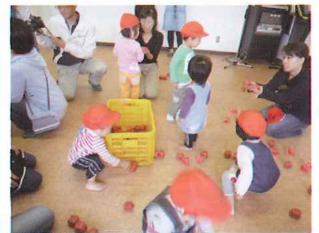
子育てサロン (白浜 のびのび白浜)