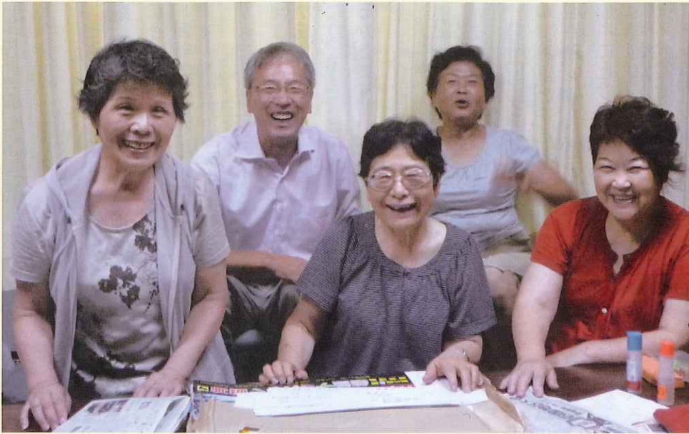
八幡浜角笛を観る会のみなさん

八幡浜市、伊方町、西予市の保育所、幼稚園、小学校、関係機関の皆様にご協力いただきながら、活動を続けています。