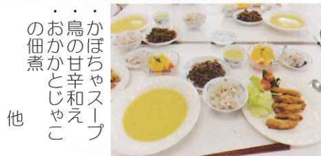
聴覚障がい者料理教室 (H23.2.26 保健センターにて)