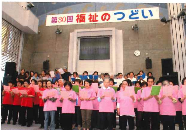
新町ドームに歌声がこだましました

最後には、4団体によるコーラス・合唱が行われました。童謡の会「うらら」によるハンドベル演奏、松蔭ひろばによる『いつでも夢を』歌唱、心身障害者(児)団体連合による『みかんの花咲く丘』歌唱の後、ゆりかごの里を含めて総勢約100名で合唱をしました。曲は、『花は咲く』と『ふるさと』。来場者の歌声も合わさり、会場内が音楽でひとつになりました。