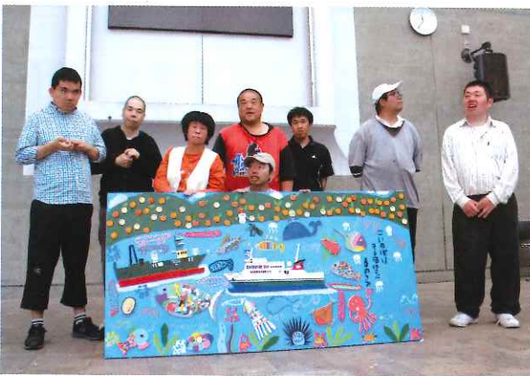
目を引くアートと作成した仲間たち