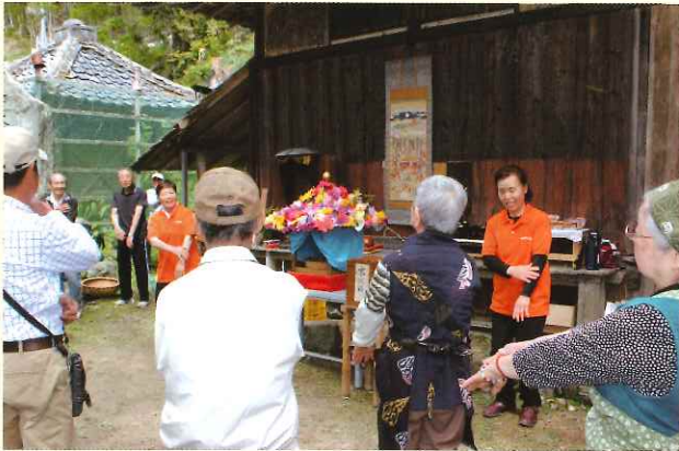
体操に励んで、介護予防