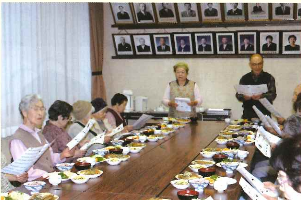
昼食前には皆で口腔体操