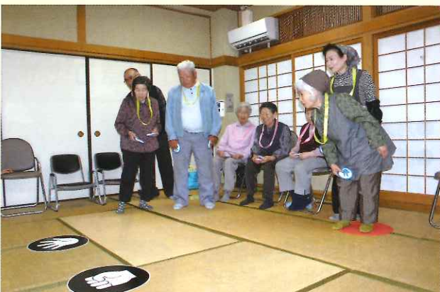
じゃんけんペタンコで大笑い