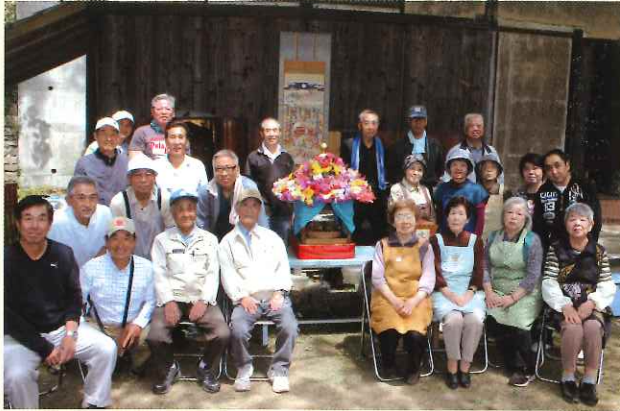
甘茶会終了後に集合写真撮影