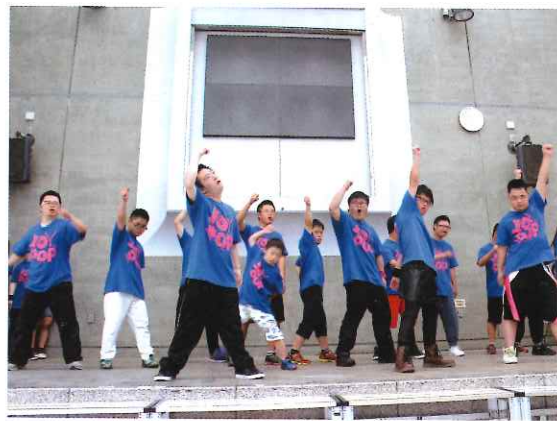
いきいきと輝く表情で踊るメンバー

30回を記念して、愛媛県内を中心に様々なイベント・施設でダンスを披露しているダンスグループ「JOYPOP」(ジョイポップ)を招きました。構成メンバーは、主にダウン症のある人達