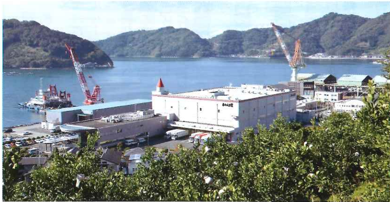
あわしま堂本社工場（保内町川之石）

そして、当事者の方は、笑顔で和菓子・洋菓子を食べ、「ホッとしたり」「落ち着いて物事が考えられる」と語られます。食糧支援に関する事、生活に困難を抱えている人は社協地域福祉課へ23-2940までご連絡をお願いします。