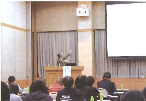
平成29年度虐待防止セミナー