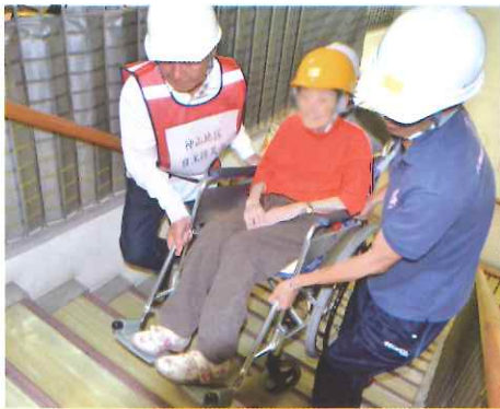
湯島の里 自主防災の皆さん協力の元、避難訓練