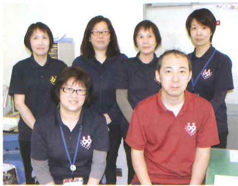
各部署、笑顔を中心がけて 支援にあたっています