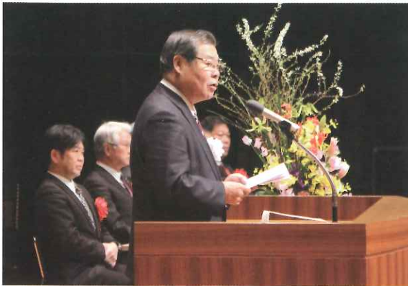
平成29年度八幡浜市社会福祉大会

国が制度・分野ごとの「縦割り」や「支え手」「受け手」という関係を超えて、地域住民や地域の多様な主体が「我が事」として参画し、人と人、人と資源が世代や分野を超えて「丸ごと」つながることで、住民一人ひとりの暮らしと生きがい、地域をともに作っていく社会を目指す「地域共生社会」を提唱したことを受け、その動向を十分に把握し、社協が推進してきた地域福祉の基盤整備と地域での実践が一層促進されるような取り組みを強化します。