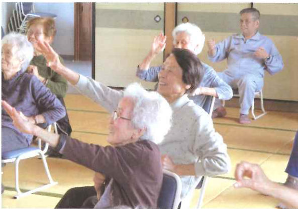
ふれあい・いきいきサロン（雨井なかよし会／川之石）