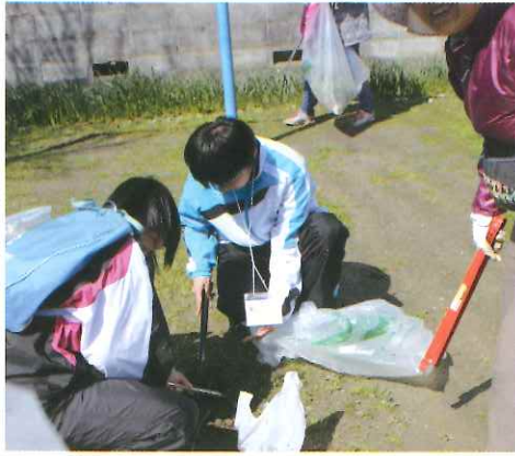
公園にも小さなゴミがちらほら

最初に、八幡浜市ボランティア協議会（以下、市ボラ協）主催の市内清掃に参加しました。市ボラ協加入団体や養護老人ホーム入所者、個人ボランティア等有志の方々と学生混合で、5つのコースに分かれて市内清掃を行いました。