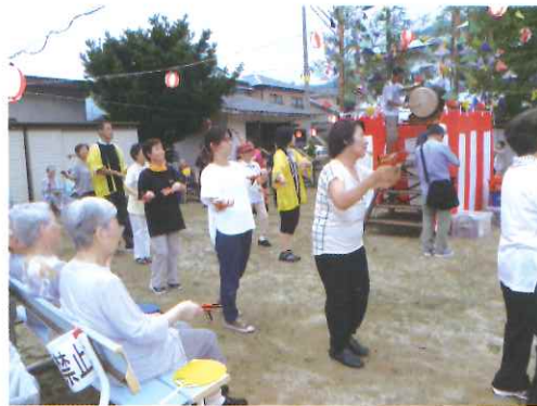
あけぼの荘 地域の方々と一緒に盆踊り