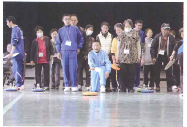
一投一投大切に「ナイスショット！」

2日目は、障がい者スポーツ大会を開催しました。八幡浜市中心身障害者(児)団体連合会をはじめ、市内の作業所利