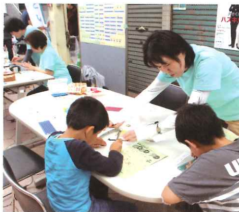
点字名刺作りに挑戦！

31回目の福祉のつどいも、多くの方にご支援ご協力をいただき、盛況の元に終えることが出来ました。「新たな一歩」を踏み出し、「しあわせ」を共有し分け合う機会となりました。