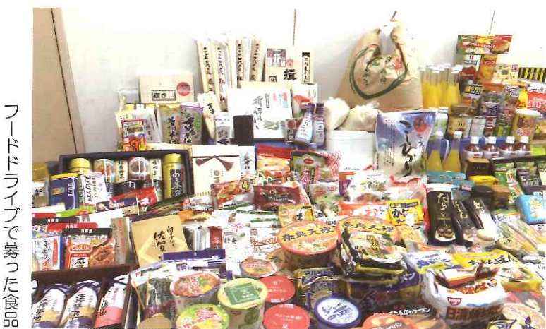
フードドライブで募った食品

市社協では、八幡浜市より自立相談支援事業を受託し、年間約50世帯の新規相談を受けています。支援内容は、生活の立て直しに向けての相談・同行、医療・制度の利用支援、ボランティア活動を通じた意欲の向上、就労支援等です。相談の中でも多いのは、「お金がない」「しばらく何も食べていない」というニーズです。寄付で募った食品を提供することで、当事者が安心する大きな糧になっています。