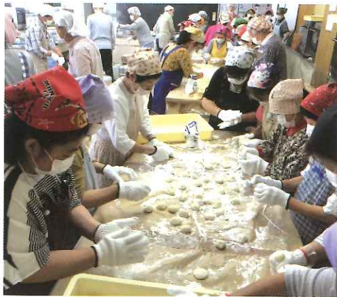
次々できあがる餅を手際よく丸める

また、新町商店街振興組合の協賛により餅まきで配られる商品券は、精神保健ボランティアグループはまかせの皆さんがアメを詰めた袋に同封されます。開催前から、多くのボランティアが準備に取り組みました。