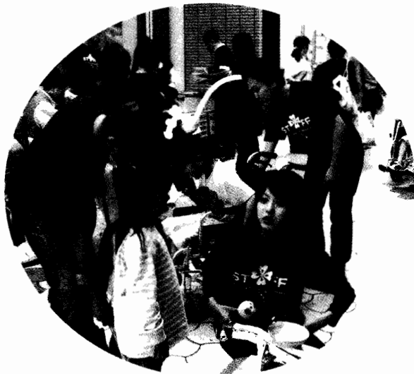
商店街も賑わってます!!