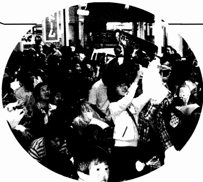
餅撒き みんな必死!!