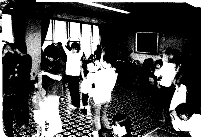
千丈地区子育てサロンの様子