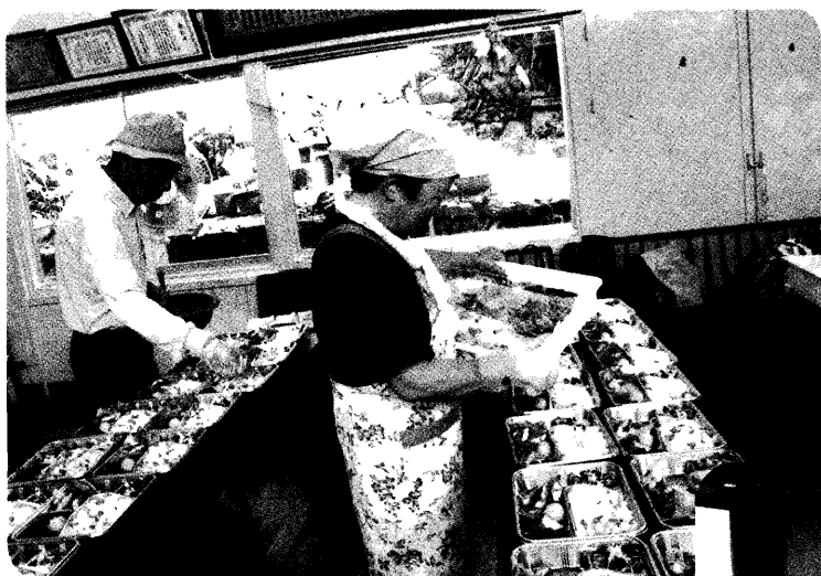
白浜地区給食サービスの様子