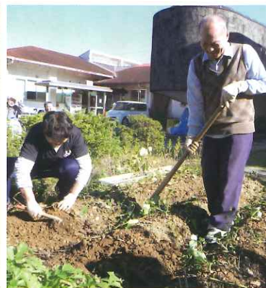
あけぼの荘 敷地内の畑づくり