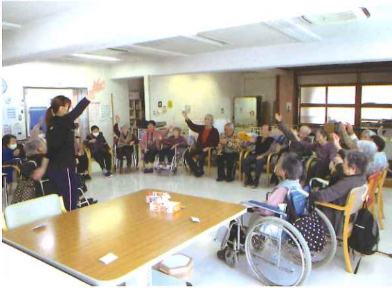
デイサービスの1コマ