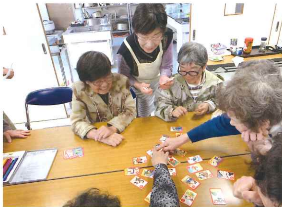
喜須来地区『いきいき喫茶』