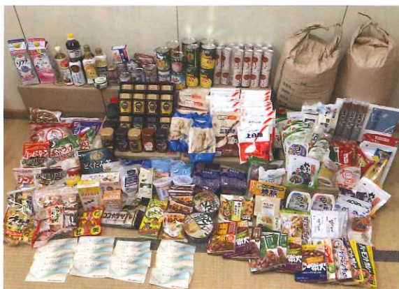
フードドライブで集まった食品