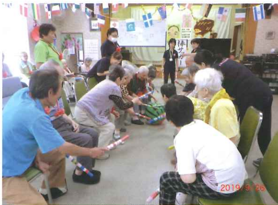
湯島の里 運動会『ベンチサッカー』