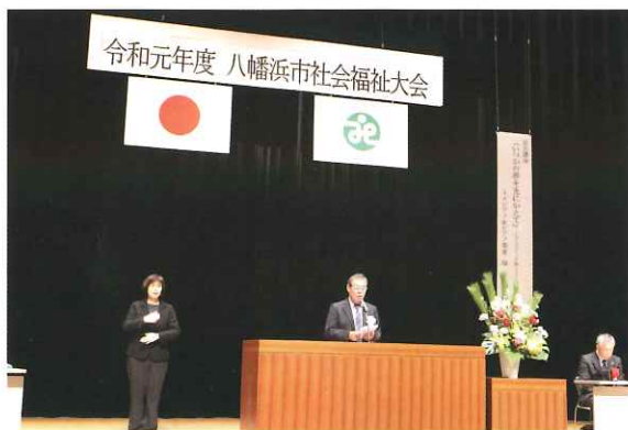
令和元年度 八幡浜市社会福祉大会