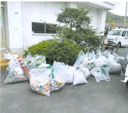
集まったゴミの一部。空き缶もたくさん