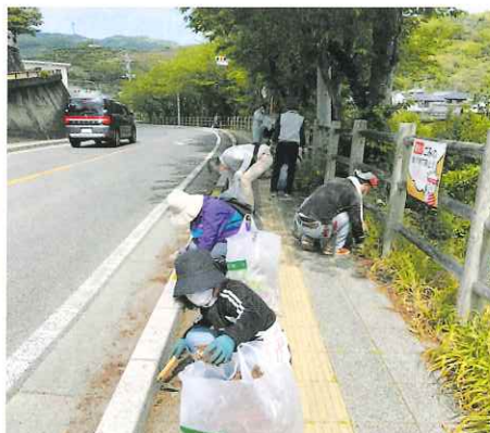
国道沿いの雑草や苔、枯葉を除去