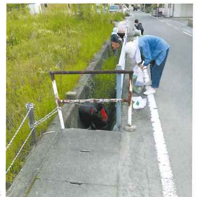
側溝に降りて雑草などを取る