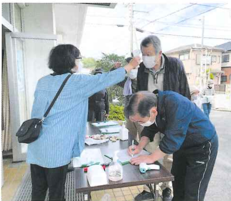
手指消毒・検温・名簿作成で感染対策