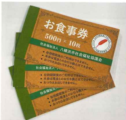
お財布に収まるサイズで作成

新型コロナウイルス感染症拡大に伴うひとり親世帯等支援事業 お食事券を多くの世帯に利用いただきました