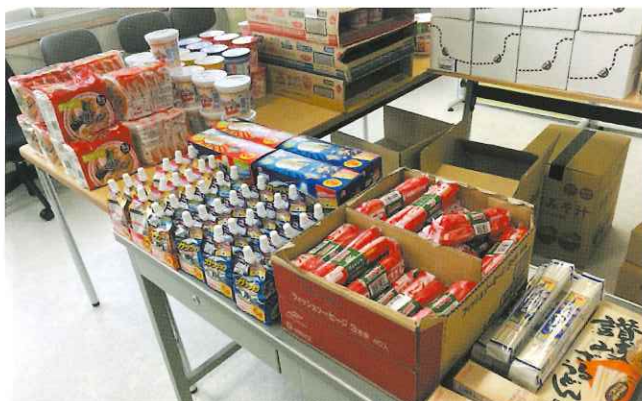
寄付を募っています

来所者同士で気にかけてあいながら、遠慮がちに受け取っておられ、「助かった」「この取り組みは続けてほしい」「はじめて社協に来た」等の