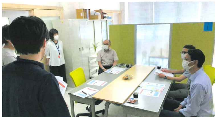
相談会の打合せの様子