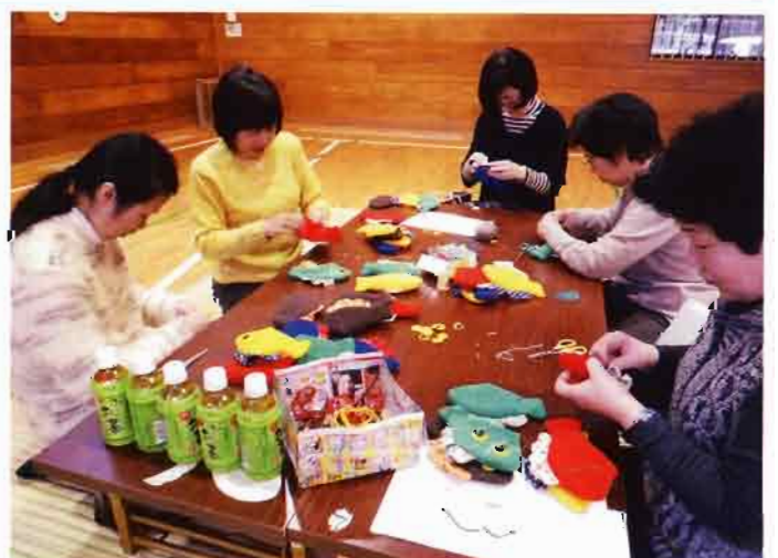
子育てサロン研修会