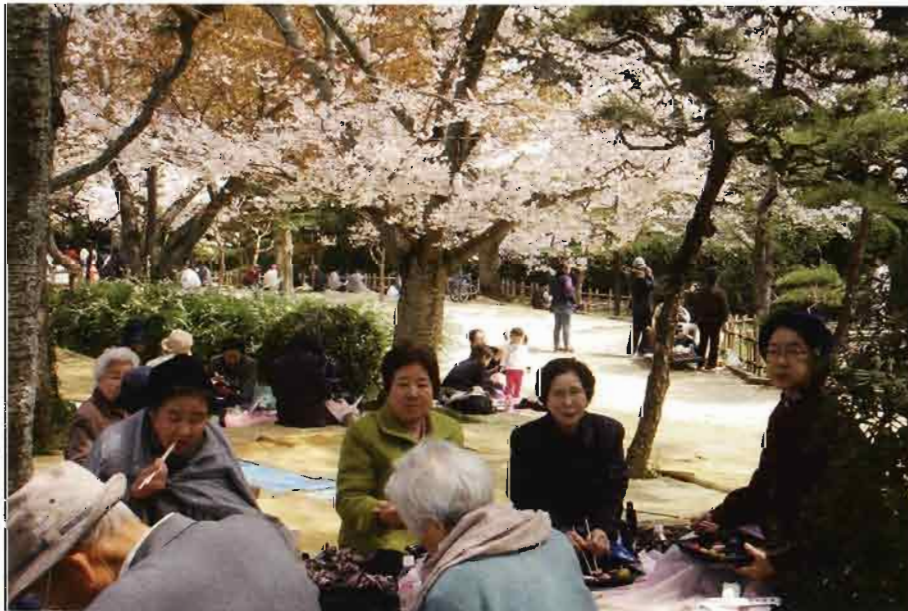
生きがい活動支援事業一桜の花にさそわれてー