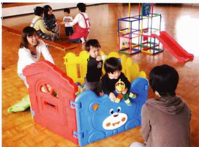
川上地区「いないいないばあ」 サロンに来れば友達いっぱい 楽しいよ