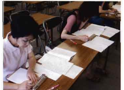
点訳奉仕員養成講座一点字で文字をー