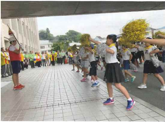
令和元年度 白浜小学校によるパレードの様子