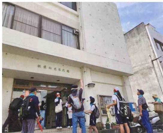
八幡浜市の最大津波高は9.1m(想定)高さを確認する参加者